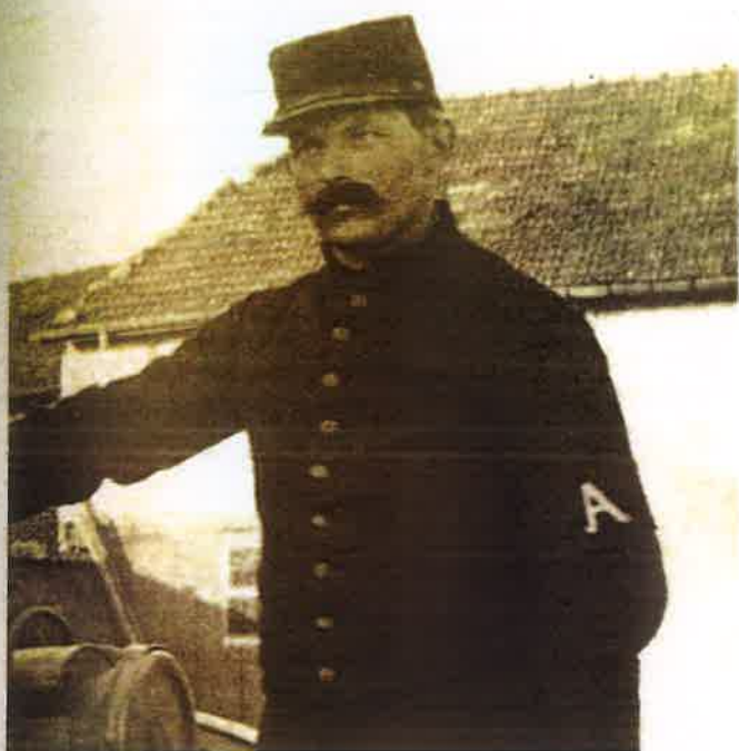
Agrandissement de la photographie précédente montrant un brassard au premier type. Enlargement of the previous picture showing a first-type armband.