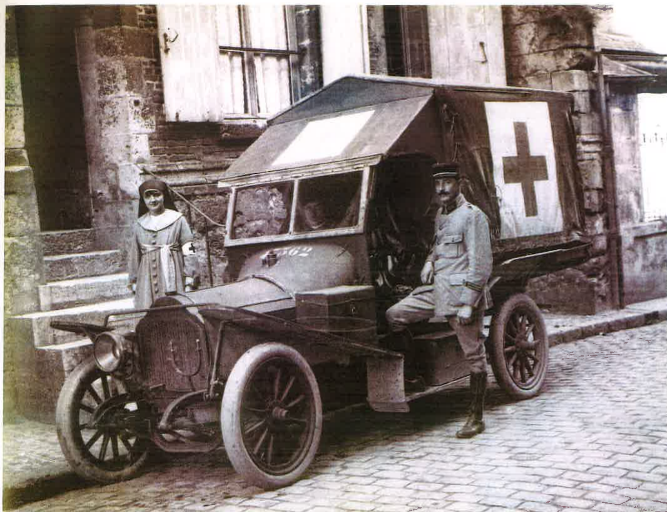
Voiture d'ambulance Lorraine-Dietrich 1912 12 HP. Ambulance Lorraine-Dietrich 1912 12 HP.

Right : Arm badges (after July 1917) for rank and files, NCOs and officers.