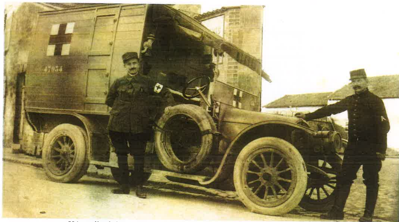
Voiture d'ambulance avec ses panneaux en bois. Ambulance with its wooden panels.